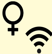
Droit des Femmes & Numérique