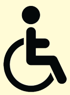
Handicap & insertion